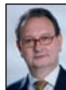
Dr. Stefan Lutz Mazars Revision & Treuhandgesellschaft mbH